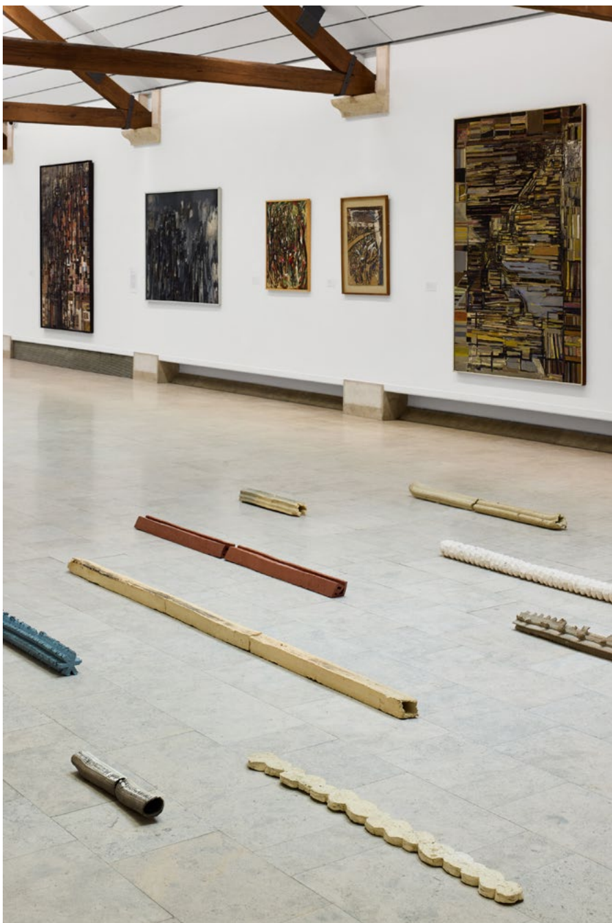
Vista da Exposição; Vasco Futscher, Broken Mile