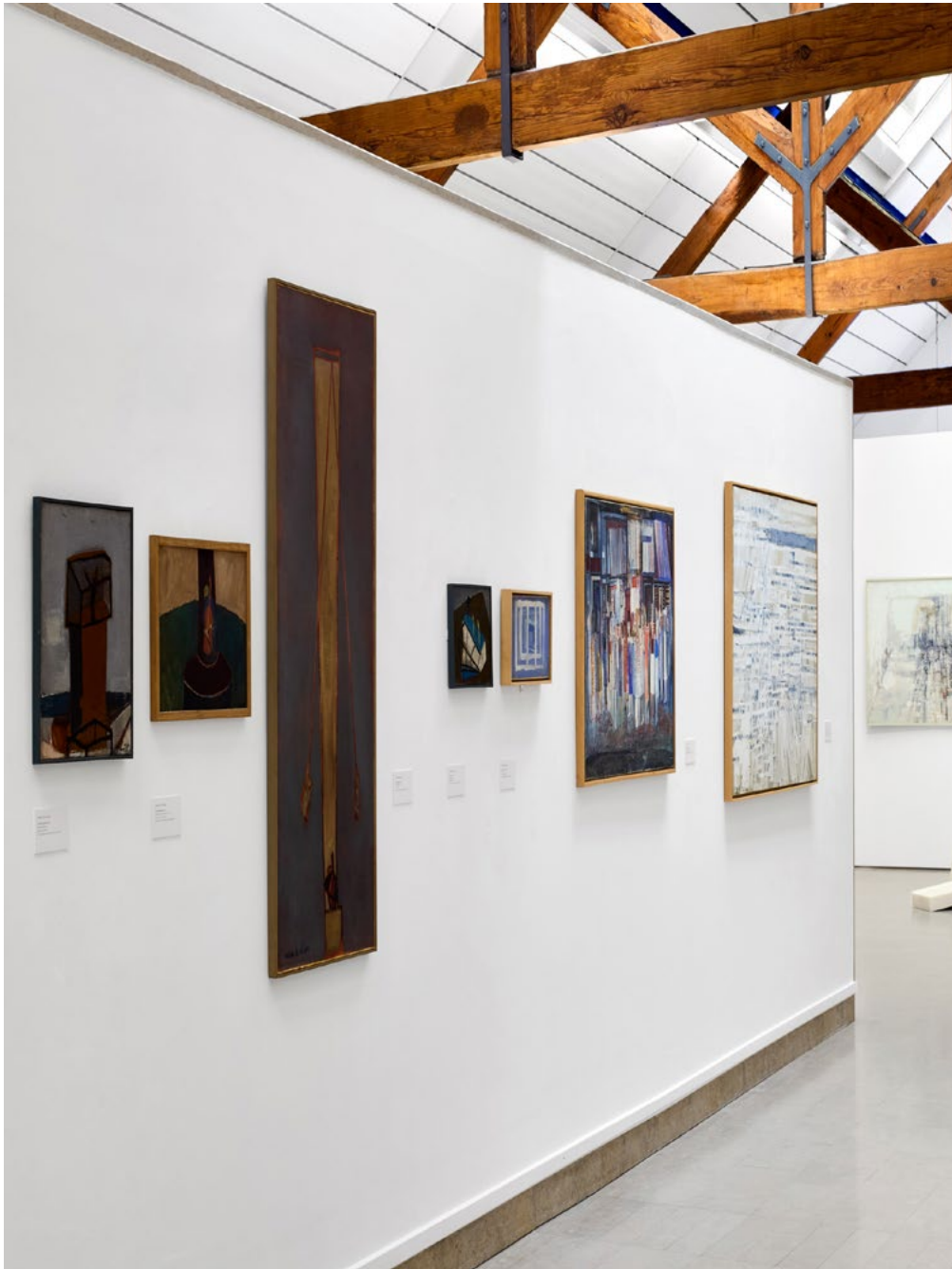
Vista da Exposição